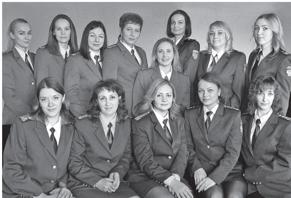
Специалисты отделов камеральных проверок, в функции которых входит контроль за соблюдением законодательства в отношении расчетов страховых взносов, в НДФЛ, деклараций по НДС и налогу на имущество организаций, а также осуществление работы по легализации теневой заработной платы

Раньше мы каждые три года totally проверяли практически всех налогоплательщиков, выходя на предприятия, сейчас подход к контрольной работе несколько иной. Мы стали более открыты для налогоплательщиков. Вне-