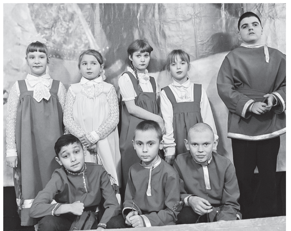
Детский хореографический коллектив перед выходом на сцену

Завершится фестиваль гала-концертом и выставкой декоративно-прикладного творчества 2 декабря в Великом Новгороде.